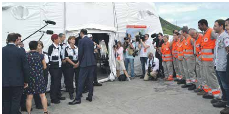
Les ministres saluent le travail de EPRUS et de la Croix Rouge, installées sous une tente sanitaire à Quartier d'Orléans

Toujours à Quartier d'Orléans, les ministres sont allés saluer les organisations humanitaires EPRUS et la Croix Rouge installées dans une tente dispensaire à Quartier d'Orléans.