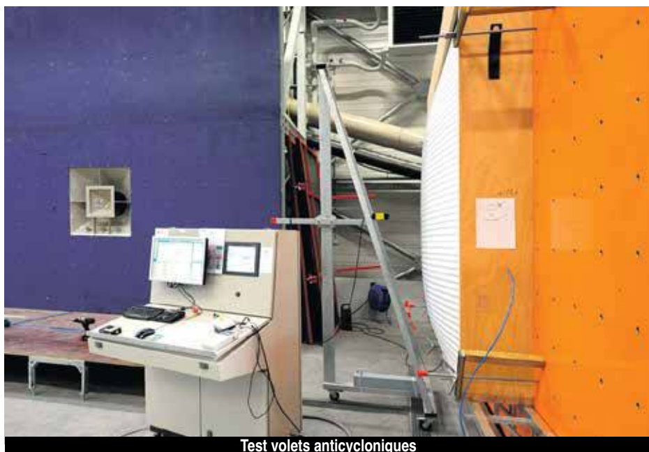
Test volets anticycloniques

Les volets anticycloniques installés par la société King Shutter ont fait leur preuve. Et quelles preuves ! Malmenés pendant plusieurs heures par les vents rugissant d'Irma et par une flopée d'impacts volants, et certes, à l'exception de ceux installés sur des maisons qui ont été entièrement détruites par le passage de l'ouragan, tous ont résisté.