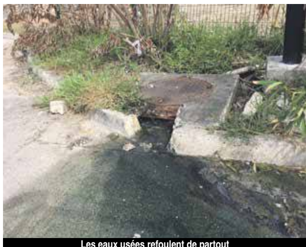
Les eaux usées refoulent de partout

Comment remettre en route et rouvrir des établissements en bord de plage dans des conditions aussi déplorables ? En effet, on constate que tout le système du tout-à-l'égout se déverse dans la mer. Depuis les terres, traversant la plage, une eau opaque et nauséabonde ruisselle vers la mer. Où en sont les stations d'épuration ? Sont-elles toujours obsolètes ? Y a-t-il un programme prévu pour réorganiser les évacuations à court terme ? L'exemple d'Orient bay n'est hélas certainement pas le seul sur l'île. De toute évidence, il n'est certainement pas souhaitable que la population se baigne depuis cette plage, si belle soit-elle.