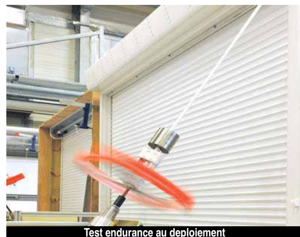
Test endurance au déploiement

Contact : 0690 229 009 Email : jl.garreau@fbusxm.com (agence s'abtenir)