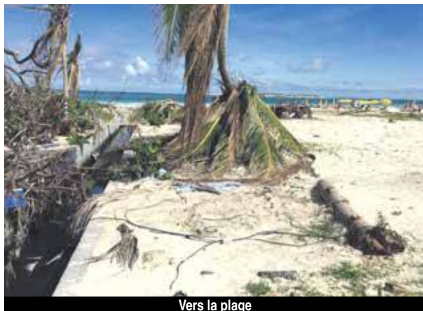
Vers la plage

La situation est plus qu'alarmante, et aucune information ne filtre sur le sujet de la pollution de la plage d'Orient Bay.