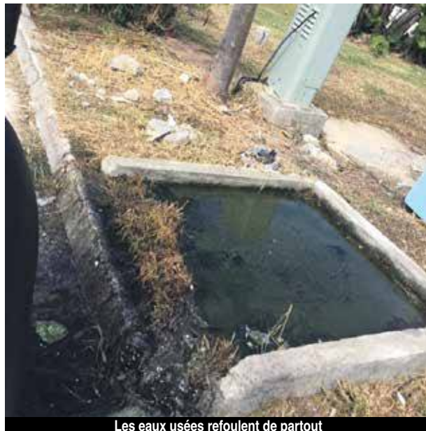
Les eaux usées refoulent de partout

Comment remettre en route et rouvrir des établissements en bord de plage dans des conditions aussi déplorables ? En effet, on constate que tout le système du tout-à-l'égout se déverse dans la mer. Depuis les terres, traversant la plage, une eau opaque et nauséabonde ruisselle vers la mer. Où en sont les stations d'épuration ? Sont-elles toujours obsolètes ? Y a-t-il un programme prévu pour réorganiser les évacuations à court terme ? L'exemple d'Orient bay n'est hélas certainement pas le seul sur l'île. De toute évidence, il n'est certainement pas souhaitable que la population se baigne depuis cette plage, si belle soit-elle.