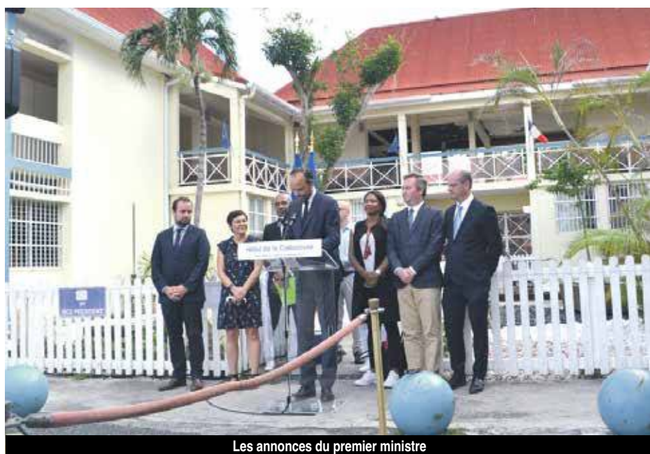
Les annonces du premier ministre

Ainsi, les suspensions de ces charges pourraient courir jusqu'en novembre 2018, date à laquelle une partie de l'activité devrait reprendre. Les remboursements de ces dettes devraient être effectifs à compter de 2020, et il est prévu un étalement sur cinq ans de la dette accumulée.