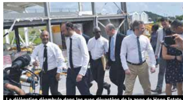
La délégation déambule dans les rues dévastées de la zone de Hope Estate

La visite ministérielle s'est poursuivie au pas de course dans la zone de Hope Estate. Un bref passage parmi les commerçants situés dans le mall Aventura, le seul édifice à peu près indemne de la zone. La délégation s'est ensuite retrouvée dans le restaurant Chez Maguy pour une collation avant de regagner Marigot.