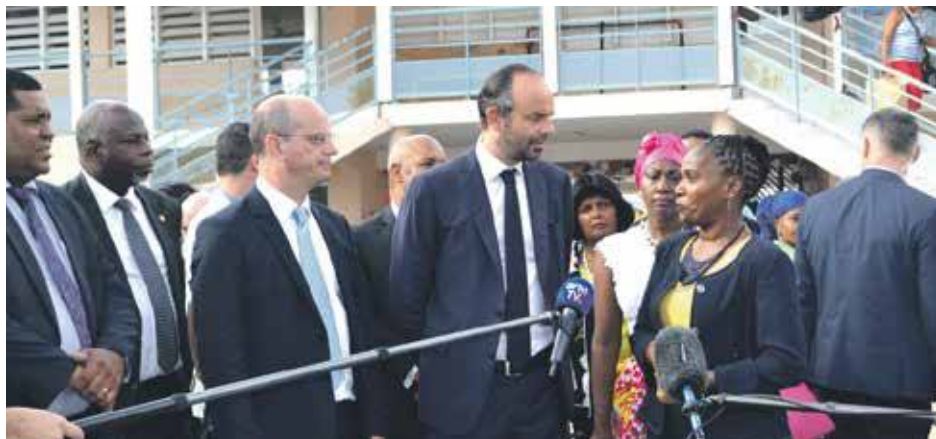
Le 1 er ministre et le ministre de l'Education nationale s'entretiennent avec la directrice et les professeurs de l'école Clair Saint-Maximim

communauté éducative pour activer le retour des élèves dur les bancs de l'école. Le ministre de l'Education a quant à lui indiqué que si les chiffres précis des effectifs seraient communiqués dans les prochains jours, il pou-