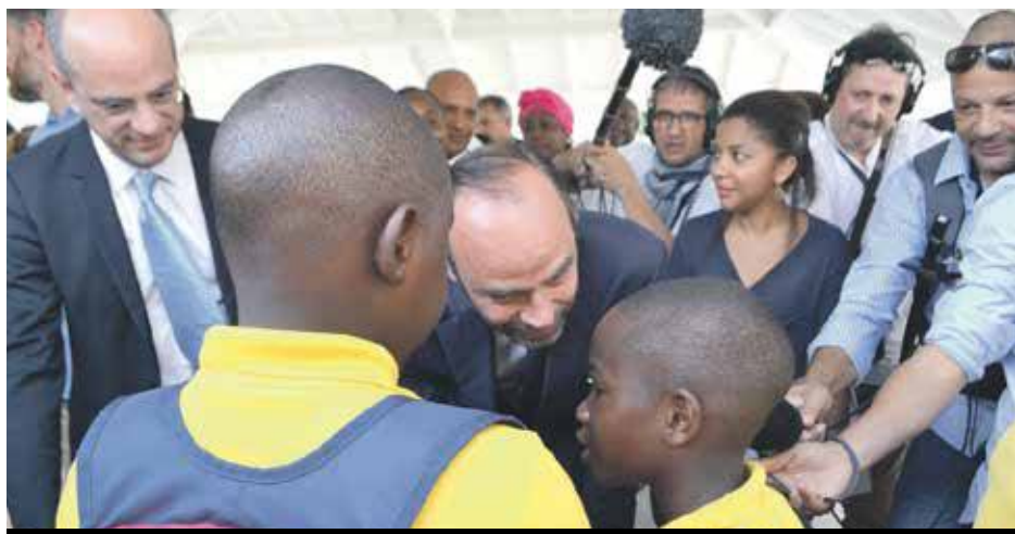
Edouard Philippe à l'écoute des enfants

à Saint-Martin. C'est toutefois une vraie rentrée qui s'est déroulée dans des conditions aussi satisfaisantes que possible », saluant la grande mobilité de la