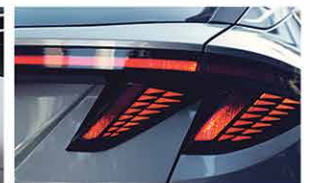
Combinaison Arrière LED Feux Arrières

CONSEILLERS DE VENTE - ERIC "RICO" TASSO: 0690 88 52 49 | DIDIER ABENAQUI: 0690 22 29 97