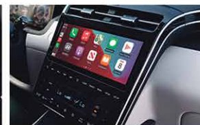
Écran Tactile 10,25 Pouces Avec Façade Centrale Entièrement Tactile