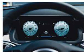
10.25 Pouces Cluster Numérique Ouvert