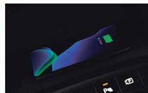
Bloc de Chargement Sans Fil Pour Smartphone