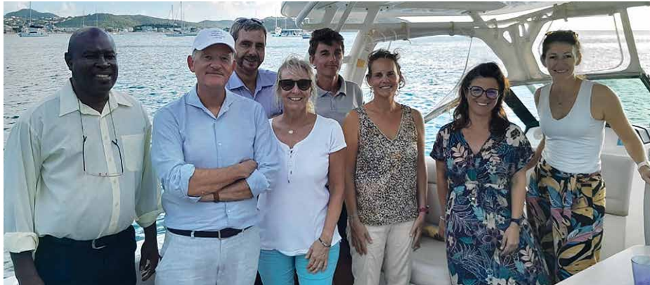
Le Préfet, entouré d'une partie des membres du Comité Local de l'IFRECOR lors d'une reconnaissance au Rocher Créole.

Les récifs coralliens et les écosystèmes associés (herbiers et mangrove) représentent les écosystèmes les plus riches et les plus productifs de la planète (avec les forêts tropicales). Le réchauffement climatique, induisant une augmentation de la température des mers et des océans, entraîne une dégradation lente, mais continue des récifs coralliens. L'IFRECOR a mis en place, depuis 2022, son 5e programme d'actions, déclinées en 4 axes : planification et résilience, restauration des récifs, meilleure connaissance des habitats et des espèces envahissantes et, surveillance et alerte. Des axes qui seront désormais appliqués sur les îles du Nord.